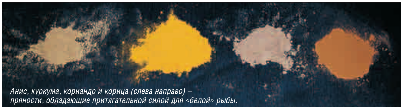
Анис, куркума, кориандр и корица (слева направо) – пряности, обладающие притягательной силой для «белой» рыбы.