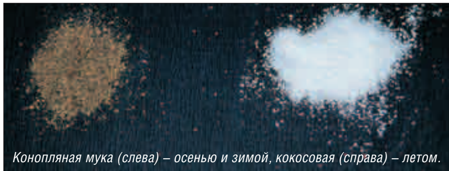
Конопляная мука (слева) – осенью и зимой, кокосовая (справа) – летом.

Льняное семя. Обладает хорошим связующим действием и пригодно для использования при ловле плотвы.